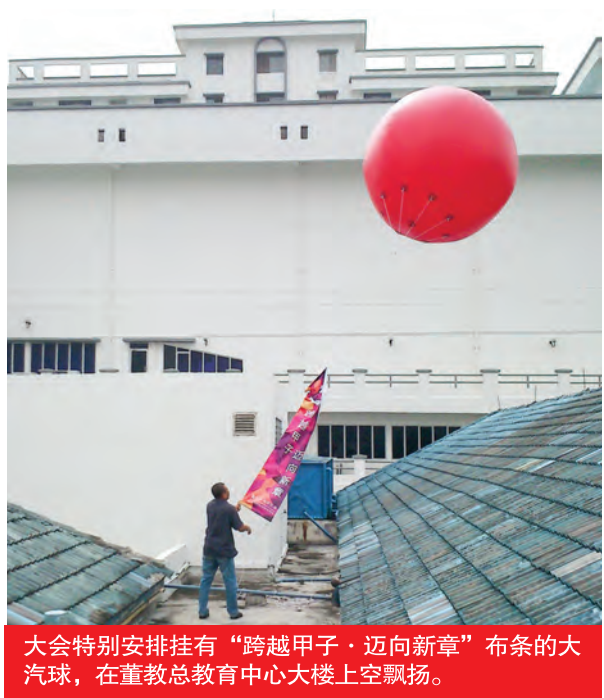
大会特别安排挂有“跨越甲子·迈向新章”布条的大气球，在董教总教育中心大楼上空飘扬。