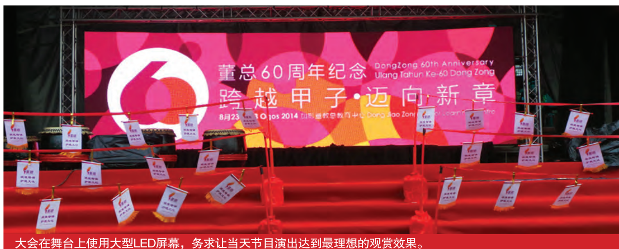
大会在舞台上使用大型LED屏幕，务求让当天节目演出达到最理想的观赏效果。