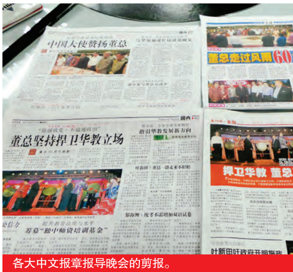
各大中文报章报导晚会的剪报。

值得一提的是，晚会主办单位特意设计纸雕仙鹤做为大会吉祥物，并赠送予在场的出席人士。仙鹤在传统华人社会，是吉祥长寿的象