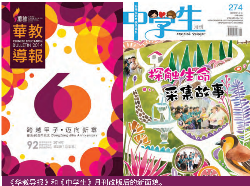
《华教导报》和《中学生》月刊改版后的新面貌。

纪念晚会的前一天，即8月22日政府订为MH17空难的全国哀悼日，故大会特别在晚宴开始前，安排全体出席者为马航MH17的罹难者，默哀一分钟。