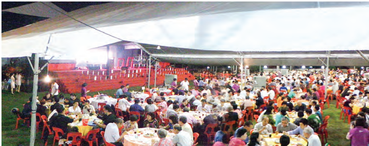
当天晚宴席开234桌，近3000人出席。