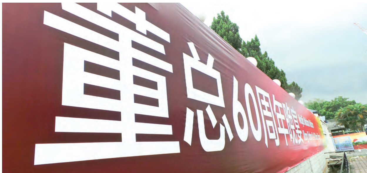
跨越甲子·迈向新章：823董总60周年晚宴。