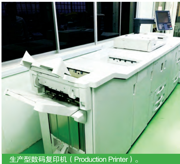
生产型数码复印机 (Production Printer)。

新的生产型数码复印机不仅印刷速度快，而且印刷的图像解析度可达1200 dpi，故符合生产量及品质的提升。生产型数码复印机的列印出错率甚低，更可以直接进行分装、对折及装订作业，大大减少繁琐的程序，缩短生产的时间，也免去过多的人力投入，达到高效率，低错误的效果。