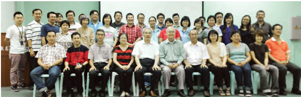
理科制订考纲培训班，主讲者为上海市教育考试院副院长兼命题办公室主任雷新勇教授（第一排左起第5位）

试纲要共17个学科（高中13科/初中4科），其余13个学科（高中9科/初中4科）将继续积极推展相关学科的考试纲要修订工作，并预计于2015年完成高初中30个学科的考纲修定工作。