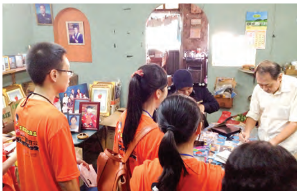
经营了69年的老相馆——百代影社，不受外面时尚照相馆影响，仍然保留最传统的建筑、店面设计，还吸引很多警员的光顾。