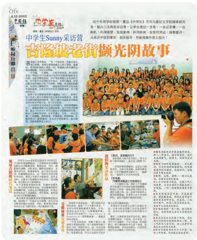
2012年中学生Sunny采访营 吉隆坡老街掀光阴故事 刊登媒体：《中国报》副刊 刊登日期：2012年12月