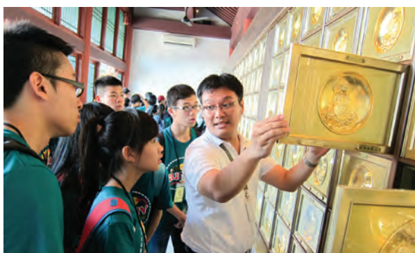
小记者们站在骨灰厅上，细心聆听解说。