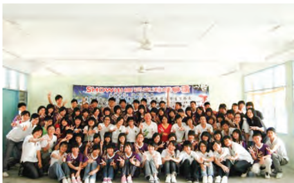
彭亨立卑中华国民型中学“show出自己之海域争霸”。