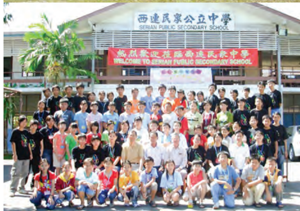
第三届彩虹计划之“心心之火 - 彩虹情怀耀西连”活动照片。