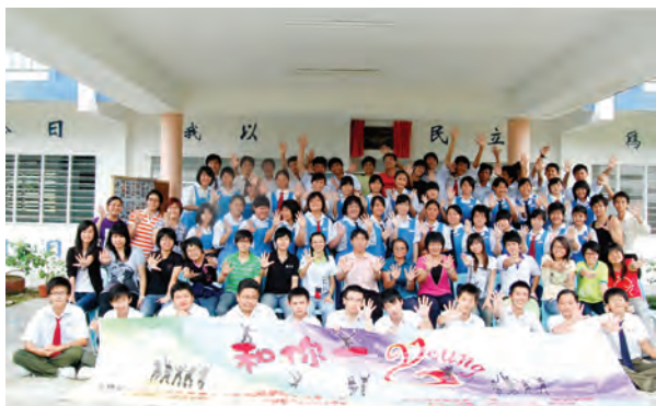
第五届彩虹计划和你一起YOUNG全体大照片。

董总学务与师资局联科组将在2014年重新加入彩虹计划筹委会，与彩虹计划的团员共同在反思与实践中迎接与创建下一个更有生命力的十年，提升社会对母语教育的关心及激发独中办学者继续前进。