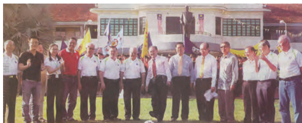
由董总主席叶新田博士（右6）及大会主席许海明局绅（右八）陪同罗兴强（踢球者）与全体嘉宾于韩江中学大操场，主持开幕仪式。

第3届全国华文独中足球锦标赛，由檳威华校董事联合会主办及檳城韩江中学协办，于2013年在檳州盛大举办。共有来自全国各州的10支球队约200多名球员竞逐争誉。本届荣幸邀请到檳州旅游发展委员会主席罗兴强，为盛会主持开球仪式。