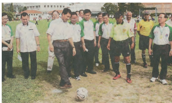
州务大臣莫哈末哈山（左3）为“第2届全国华文独中足球锦标赛”主持开球礼。

第2届全国华文独中足球锦标赛（2010年）于芙蓉中华中学举办，共有11支队伍进入决赛圈。本届荣幸获得州政府的赞助贰万令吉，方得减轻盛会开销。