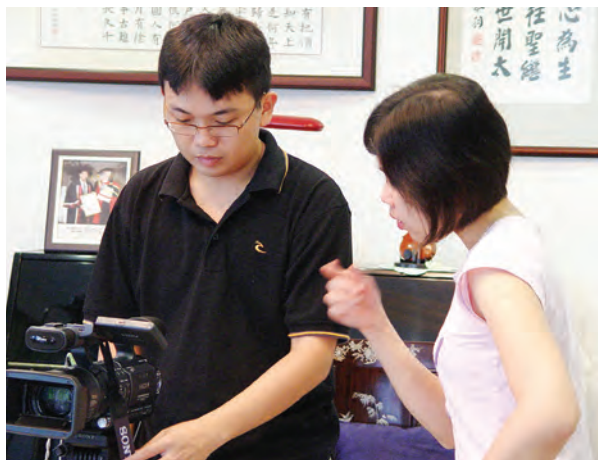
访谈员与摄影师的默契非常重要。