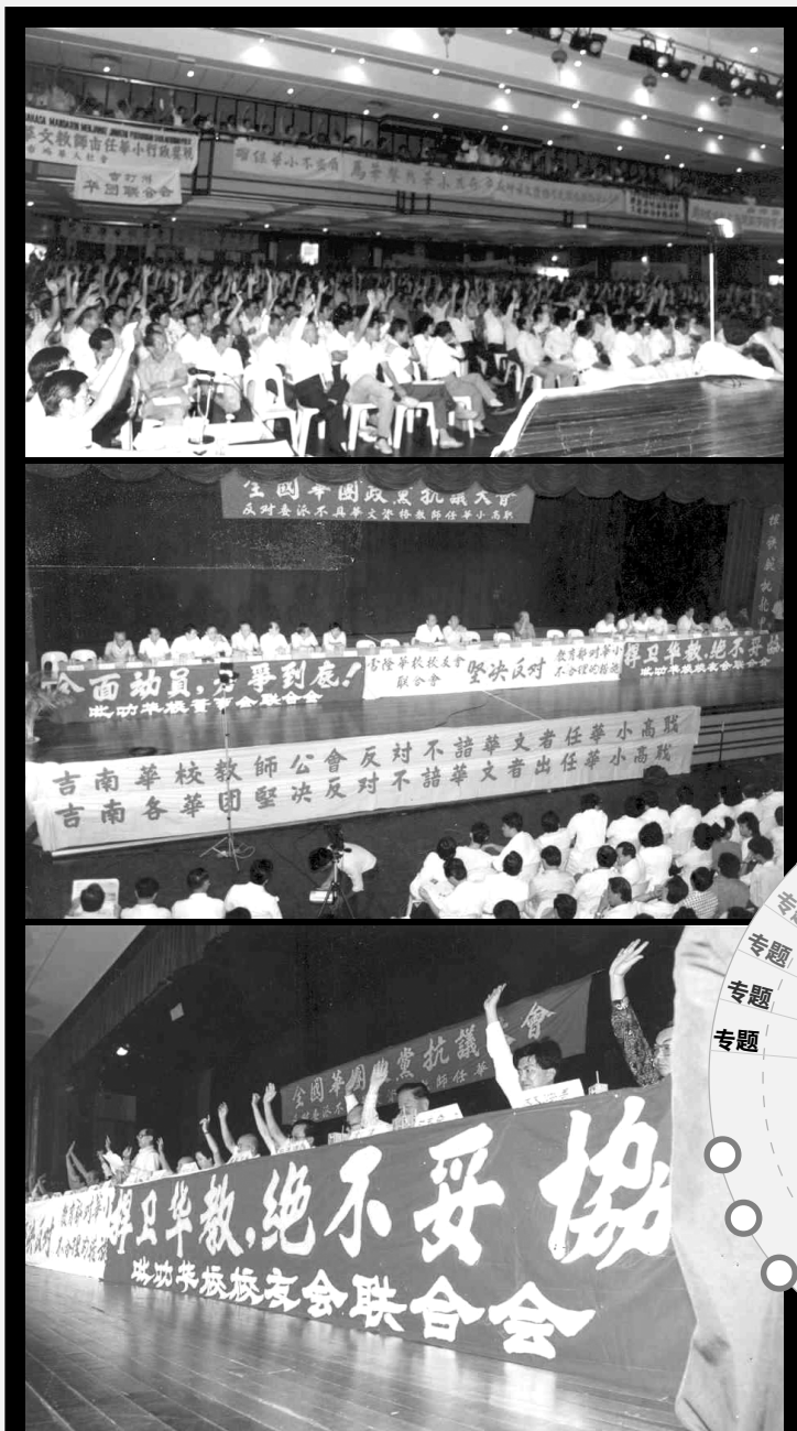
▲ 1987年10月11日，“全国十五华团行动委员会”与马华公会、民政党、民主行动党等华基政党在吉隆坡天后宫举行“全国华团政党抗议大会”。与会者多达四千多人，大会一致通过5项议决案。

华小高职问题，最后在华社的强烈反对下当局以“4-1方案”处理之。即：校长、第一及第二副校长以及下午班主任必须具华文资格，而课外活动主任只需谙华语。事后马华与民政领导人互相推责抽后脚，这起事件除了让人民进一步知道，华基政党在国阵的处境，也显示政府变质华小的政策并没有改变。《1951年巴恩报告书》消灭华、淡小的幽魂不时在作祟。因此，华社应提高警惕，严防不时出现蚕食华小的行政措施。