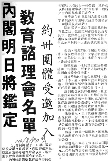
▲ 1990年8月14日的报章报道。