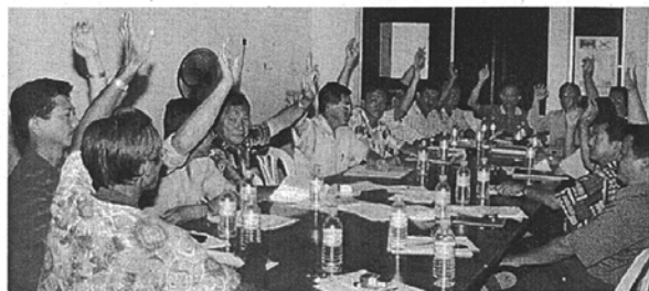
昔加末中央華小董家敦及贊助人一舉手,反對把學校納入宏願學校計劃。

【昔加末十二日訊】昔加末中央華小堅決反對併入宏願學校計劃。中央華小雖申請遷校失敗,不過,卻拒絕政府建議把該校納入宏願學校的行列。