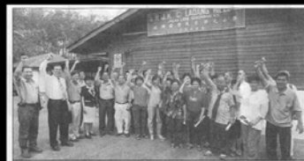
■董教总代表与丘晒园华小家长曾反对宏愿学校计划。