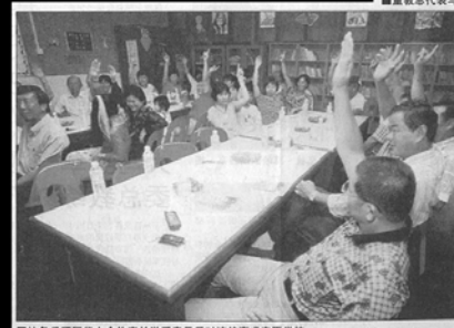
■魏务丘晒园华小全体家长举手表示反对该校变成宏愿学校。