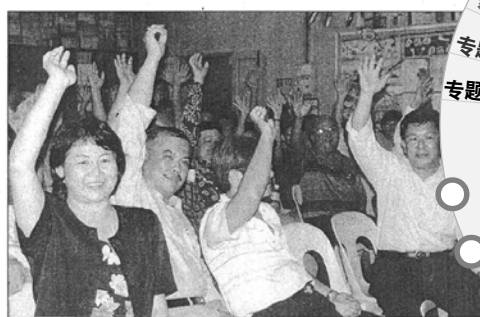
■吉北安南武吉华小家长和吉州董联会成员举手表决,一致反对宏愿学校计划。

【亚罗士打3日讯】吉打安南武吉小镇华裔家长昨晚一致表决全力支持董教总的立场,坚决反对循然华小被纳入宏愿学校计划。