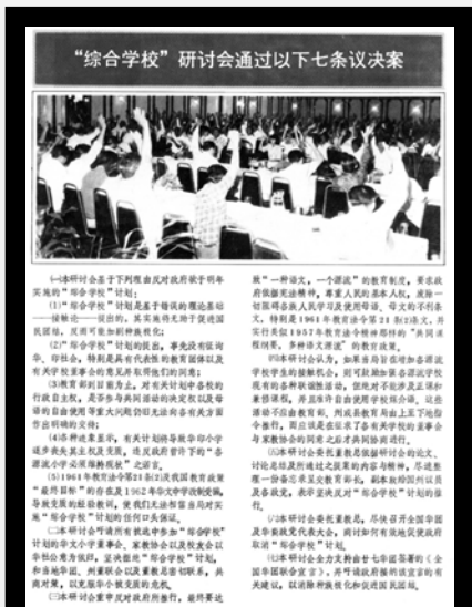
▲ 1985年11月3日，综合学校研讨会。