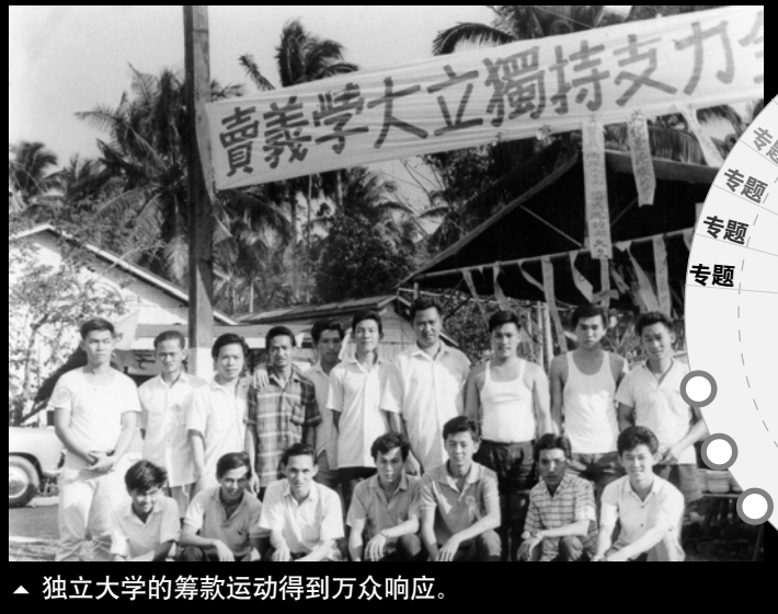
▲ 独立大学的筹款运动得到万众响应。