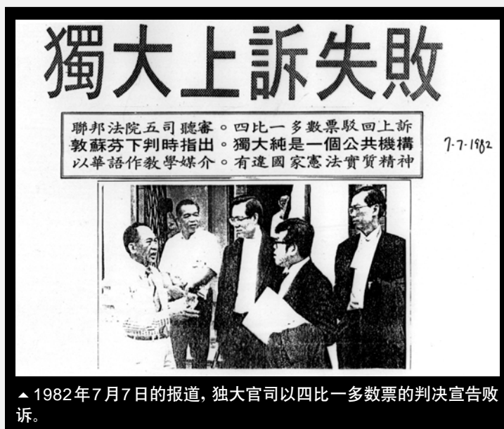
▲ 1982年7月7日的报道，独大官司以四比一多数票的判决宣告败诉。

1983年，独立大学有限公司在短短的数年内设立了“独大升学辅导处”，为华文独中毕业生开拓海外升学管道，使华文统考文凭在短短的数年内获得海外数百所大学的承认。1997年，在历经数十载百折不挠的奋斗下，董教总终于成功设立了一所民办学院——新纪元学院。此学院秉持着独立大学的精神，为莘莘学子开