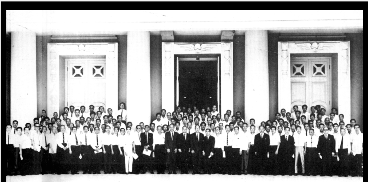
▲ 1968年4月14日，独立大学发起人大会在吉隆坡召开，成立筹备委员会，发表《马来西亚独立大学发起人大会宣言》及《创办独立大学计划大纲草案》。