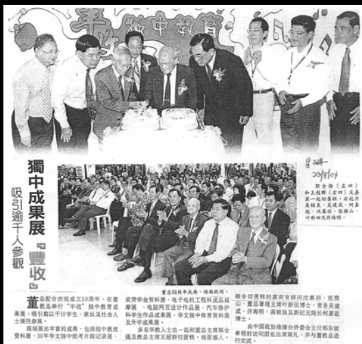
◀ 董总配合庆祝创立50周年,在董教总举行“丰收”独中教育成果展,吸引数以千计的人士涌往参观。