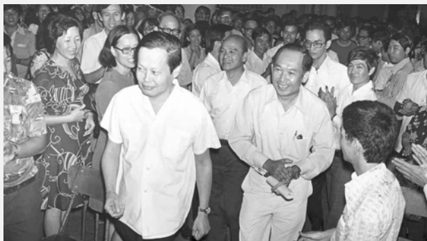
▲ 1976年，杨振宁在董教总所设的讲台上作专题演讲。

这些成绩显示，支持董教总，维护与发展母语教育事业的力量是强大的，印证了：只有依靠群众力量，华文教育才能有灿烂的明天。