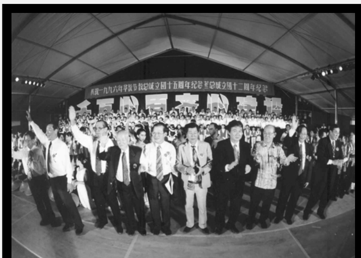
▲ 千万心愿·齐心建设三庆晚会的谢幕。

从2000至2002年的约两年内,一共筹获约二千五百万元,又一次达到预期的目标。