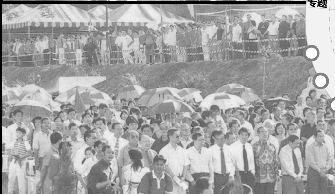
▲ 配合721华教盛会,董教总举行饮水思源楼及教学楼的落成典礼,吸引近1万人出席观礼,分享华教成果。