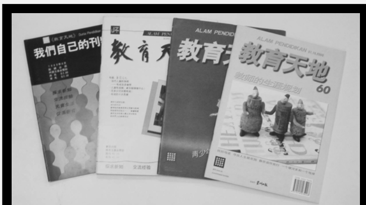
▲《教育天地》——教师精神粮食。