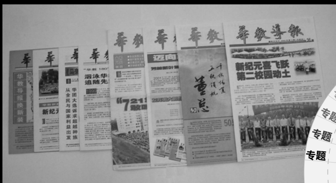
▲《华教导报》与时俱进，与众共进。

会”，展现了华教大军的“披荆斩棘起宏图”。这个时期的《董总会讯》，可以说，把华教运动的“奋斗历程与点滴成果”完整地作了记录。