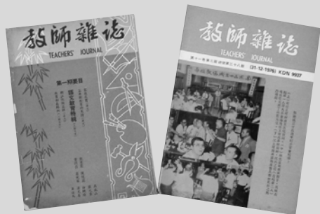
▲《教师杂志》讲真话，播真理。

半个世纪以来，在风雨飘摇的华教长征路上，董总和教总这对亲密战友，领航华教大军，为维护、发展母语教育与争取、捍卫民族权益，奋斗不息。从英殖民政府到独立后的联盟政府、国阵政府，针对“单元教育政策”下一连串不利于华教的法令及措施，董教总无不立刻给以反响与抗争。然而，在“避席畏闻文字狱”的时代，董教总的声明、文告、宣言等重要文件及华教动态，往往在媒体中难窥全豹。为了突破形形色色的封锁，董教总出版会讯等刊物，就成了传达华教信息的管道，是“感应的神经，攻守的手足”。