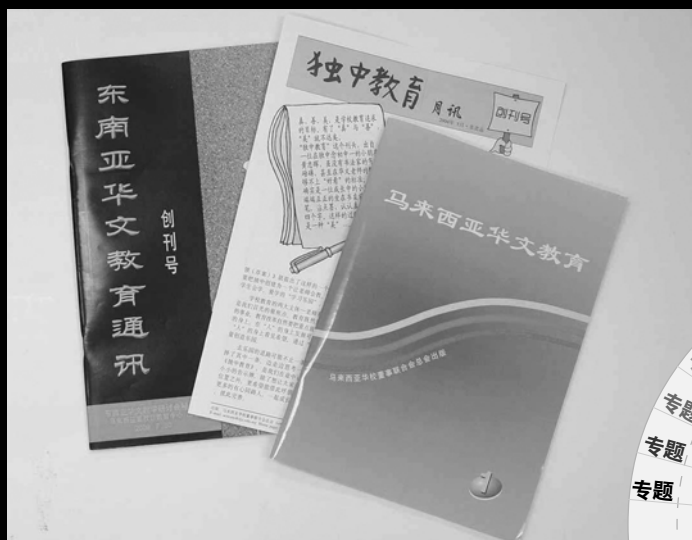
▲《东南亚华文教育通讯》、《马来西亚华文教育》、《独中教育》,华教、教学与教育研究期刊。

月,16开8版,分量似乎很轻,但赋予董总学务处的任务却很重,那就是要把各地独中教改经验、董教总《独中教育改革纲领(草案)》修订进展、素质教育理念等资讯,传送给全国独中老师,从而激起不绝回荡。