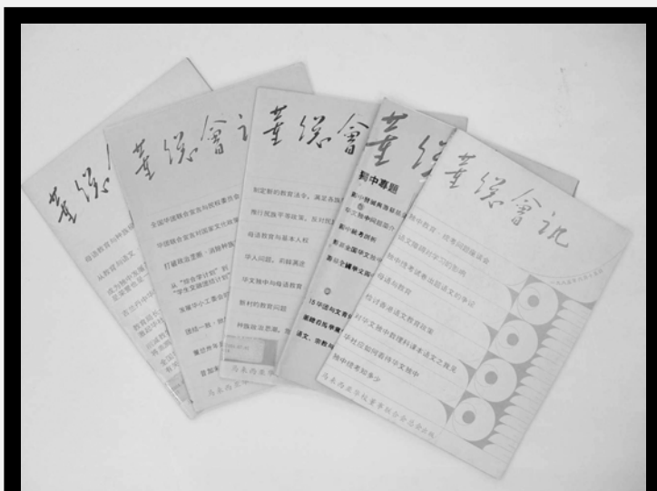
▲《董总会讯》，1984年至1994年华教运动奋斗与成果的记录。

在这十年间，前5年华教依然面临“暗流汹涌，风雨如晦”，例如教育当局训令“华小集会必须使用国语”，政府推行意图变质华小印小的“综合学校计划”，派不谙华文教师出任华小行政高职，用《内安法令》扣留林晃昇、沈慕羽等董教总领导人；在母语教育危机重重之际，林连玉先生含冤长逝。后5年，进入90年代，世界激起多元主义与民主开放的潮流，国内政治紧张局势解冻，给华教的发展带来了契机，南方学院获准开办，董教总教育中心获得注册，积极申办新纪元学院。“华教火炬行”、“百万松柏献华教”、“独大独中加影行政楼”落成时的“1219华教盛