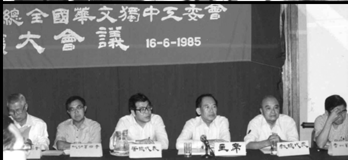
▲ 1985年6月16日，董教總全國華文獨中工委會擴大會議一致決定：獨中統一考試歷史科試卷由1986年第十二屆統考開始，統一以華文出題，其他非語文科目試卷媒介保持現狀繼續以兩種語文出題。