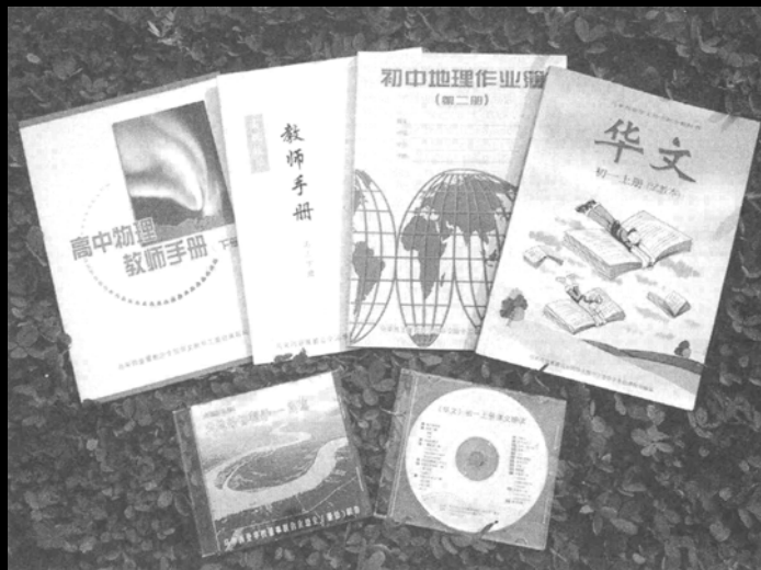
▲ 独中工委出版的各科教材、参考书与教学光盘。

存在着各方面的差异性，但因为有着一个全国统一的考试与课程，全国60所独中基本上遵循相同的办学方针，在求同存异的大原则下，办出了在我国、甚至全世界特有的一个中等教育体系。