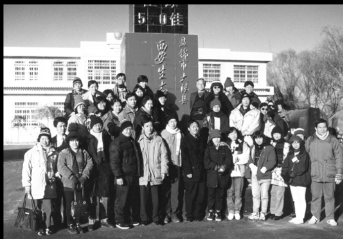
▲ 1998年12月独中工委代表与独中教师前往中国辽宁省盘锦进修考察。

度期待。受到国际上席卷而起的教育改革浪潮以及我国政府比过去较为开放和自由的建国政策影响，独中教育的发展，从过去偏重的“抗争生存空间”，逐渐转移到关注“教育专业发展”。