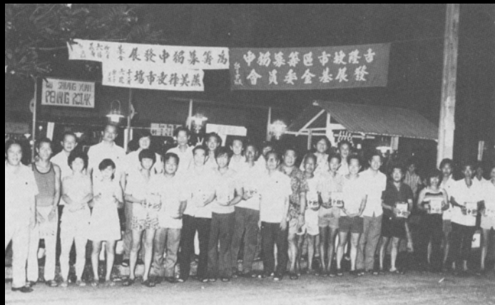
▲ 1975年华文独中复兴运动热潮中，小贩们为筹募独中发展基金举行集体义卖会。