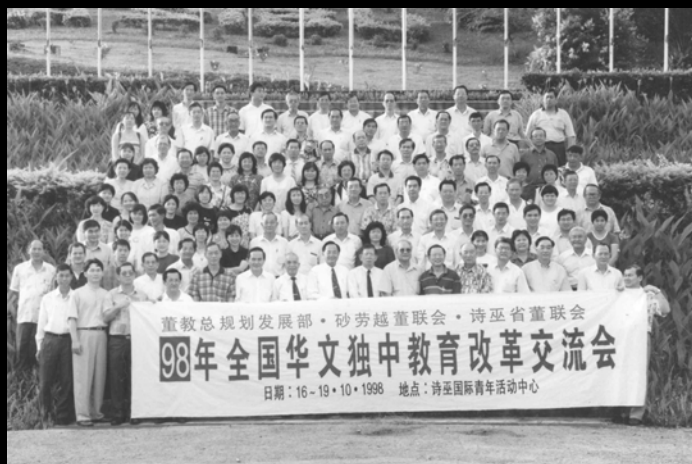
▲ 1998年全国独中教育改革交流会于砂劳越州诗巫召开。