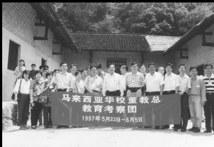
▲ 1997年董教总教育考察团赴中国湖南访问与学习“素质教育”的经验。