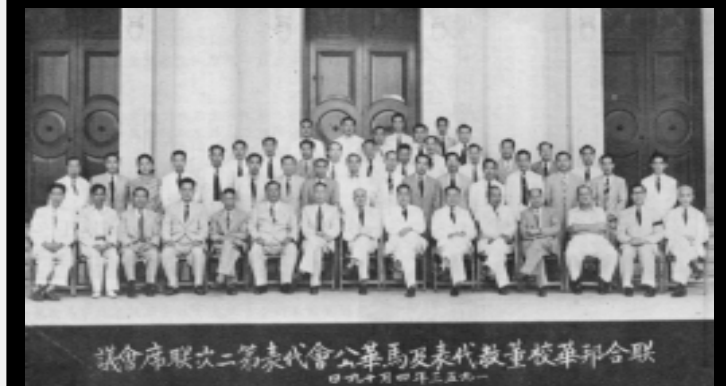
▲ 1954年4月19日，华校董教代表及马华公会代表第二次联席会议。