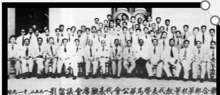
▲ 1952年11月9日，华校董教代表及马华公会代表第一次联席会议。