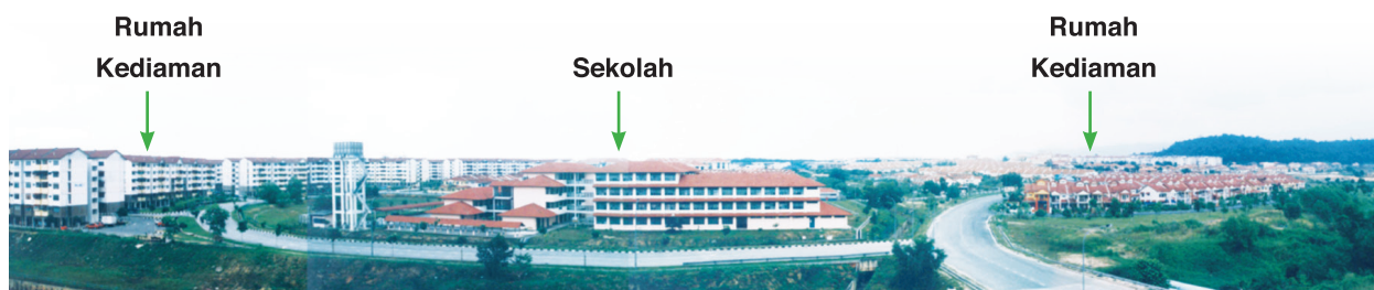
Sekolah Kebangsaan Seksyen 6, Kota Damansara, Petaling Jaya, Selangor.