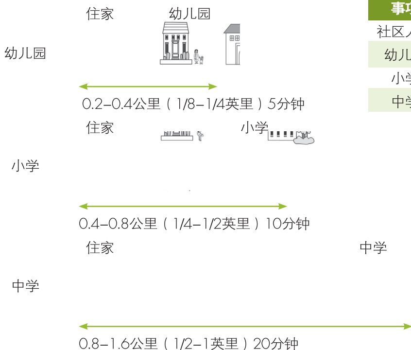
图表3：学校与住家的距离和路程时间