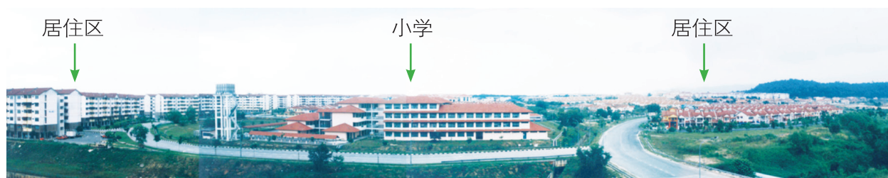
图表2：学生从住家到社区里的学校就近上学和进行课外活动