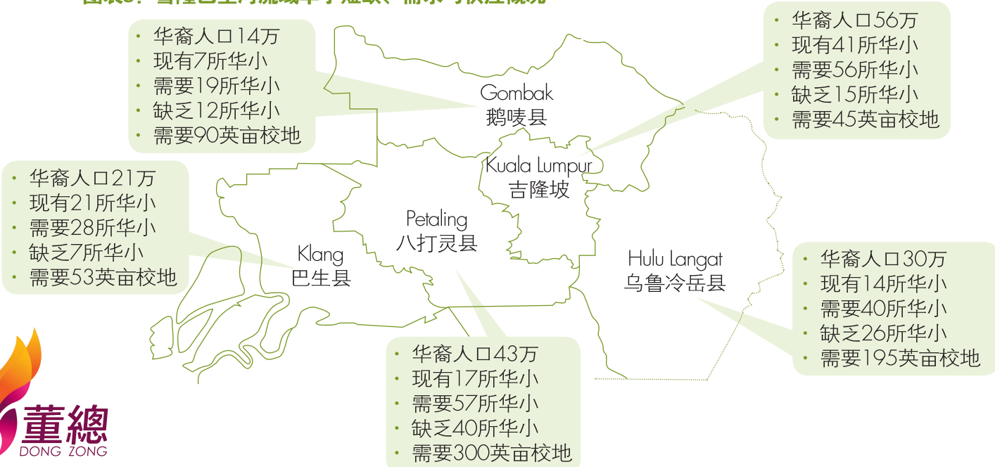
图表3：雪隆巴生河流域华小短缺、需求与供应概况